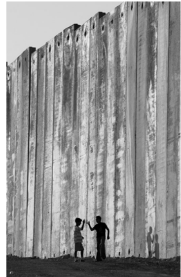
Die Mauer zwischen Bethlehem und Jerusalem

Seit bald vierzig Jahren weiß niemand in Palästina wie Frieden aussieht. Man kennt nur das Leben unter Besatzung mit hunderten von Militärgesetzen und Straßensperren, die das tägliche Leben einschränken. Meine Kinder sind in der ersten und zweiten Intifada groß geworden. Wenn sie von Ihrer Kindheit erzählen würden, sie hätten nicht viele schöne Ereignisse zu berichten.